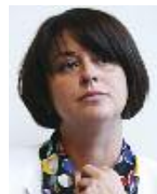
Sylvia Pinel, ministre de l'Artisanat, du Commerce et du Tourisme.

L'activité des territoires de moyenne montagne demeure trop limitée dans le temps et soumise aux aléas climatiques. « De ce fait, a souligné Sylvia Pinel, ministre de l'Artisanat, du Commerce et du Tourisme, ces stations souffrent d'un sous-investissement en matière d'hébergement et d'une mise sur le